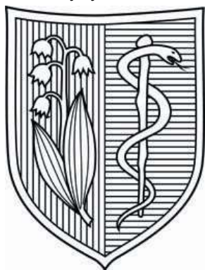
Godło w barwach monochromatycznych