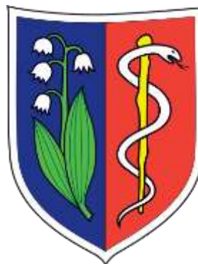
Godło w barwach chromatycznych